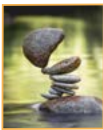
Le coup de coeur