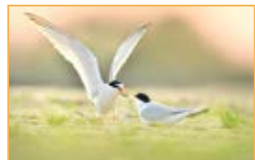
CONCOURS PHOTO INTERNATIONAL 2018 Salle Toulouse Lautrec, LE CROTOY

Une cinquantaine de photos seront proposées au public afin de leur faire découvrir les plus beaux spots nature de Picardie.