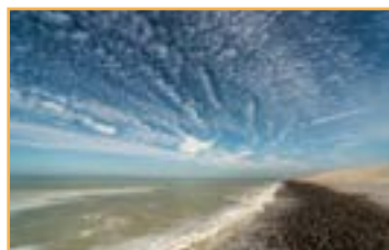
MON PLUS BEAU COIN NATURE DE PICARDIE Chapelle des Marins, CAYEUX SUR MER

Une cinquantaine de photos seront proposées au public afin de leur faire découvrir les plus beaux spots nature de Picardie.